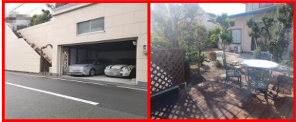
公道約8.0m バーベキューもお楽しみいただける広々とウッドデッキ付